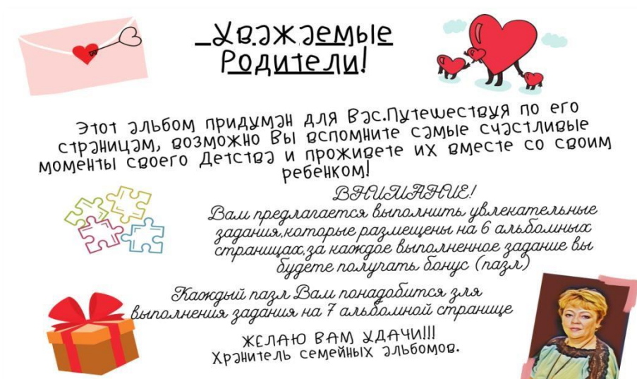
Рис. 2. Титульный лист