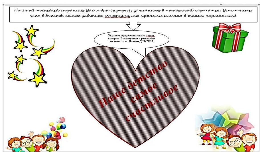
Рис. 12. Страница альбома «Секретный кармашек»