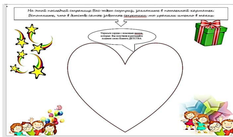
Рис. 11. Страница альбома «Секретный кармашек»