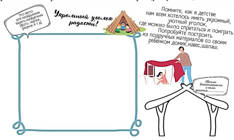
Рис. 5. Страница альбома «Укромный уголок радости»

Задание на страничке альбома «Укромный уголок радости» способствует созданию укромного секретного места для игры (рисунок 5).