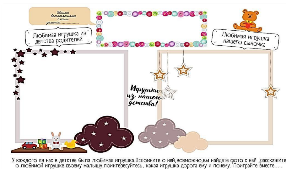
Рис. 7. Страница альбома для девочек «Игрушки из нашего детства»