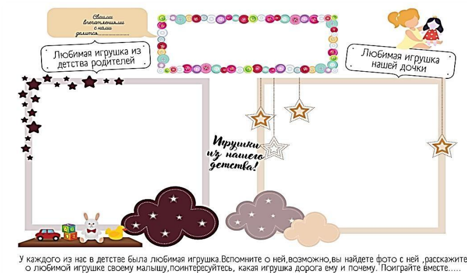
Рис. 8. Страница альбома для мальчиков «Игрушки из нашего детства»

К сожалению, роль игрушки в современном детстве обесценивается взрослыми. Они не придают им значения, не играют вместе с ними. Виртуальные гаджеты вытесняют из жизни детей кукол, мишек, машины, которые так важны для сюжетно-ролевых игр. Проводником в этот мир может стать взрослый, но для этого ему нужно понять ценность настоящих игрушек, которые не отправляют ребенка в сказочный, виртуальный, иногда жестокий мир, а учат его общаться, дружить, заботиться и радоваться в игре.