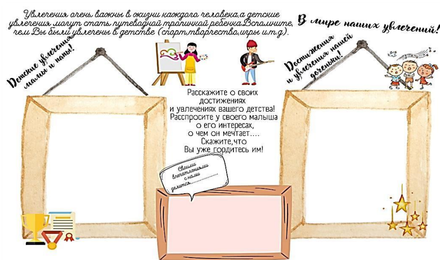
Рис. 6. Страница альбома «В мире наших увлечений»

Для оформления шестой страницы альбома «В мире наших увлечений» (рисунк 6) папам и мамам предложено вспомнить свои детские интересы, проанализировать какие радостные моменты они испытывали, когда их увлечения приносили им определенные достижения и награды. Это поможет родителям понять, а иногда и принять увлечения и интересы своих детей, испытать гордость за будущих талантливых конструкторов, чемпионов, танцоров, певцов, художников.