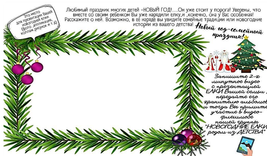
Рис. 9. Страница альбома «Новый год – семейный праздник»

Задумывались почему? Именно в Новый год взрослые снова оказываются в детстве, пусть и ненадолго, но они снова прикасаются к удивительному миру ребенка. По результатам опроса родителей стало ясно, что большинство из них ждут Нового года, чтобы снова очутиться в детстве рядом со всей своей семьей. Конечно, символом праздника для 98 % детей и родителей является новогодняя елка, поскольку именно с её появлением в доме случаются настоящие чудеса. В каждой семье новогодние елки особенные, уникальные потому, что рядом с ними и рождаются семейные традиции и ценности. Оформляя восьмую страницу квест-альбома «Новый год – семейный праздник», родители и дети рассказывают о своей новогодней красавице (рисунки 9).