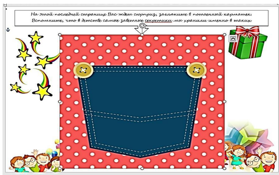
Рис 10. Страница альбома «Секретный кармашек»