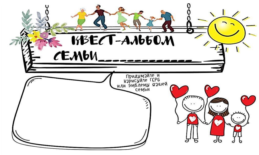
Рис. 1. Титульный лист

Хранитель семейных альбомов выдал всем участникам проекта первые две страницы. На титульном листе каждой семье предлагалось творчески оформить обложку альбома, а также придумать герб или эмблему семьи (рисунки 1, рисунок 2).