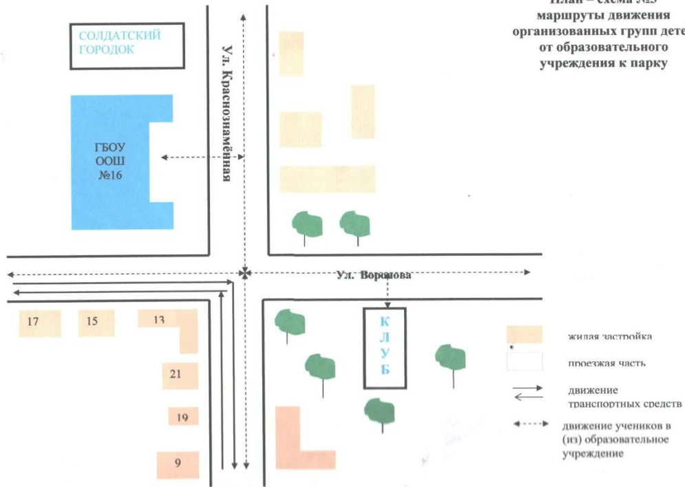
План – схема №3 маршруты движения организованных групп детей от образовательного учреждения к парку